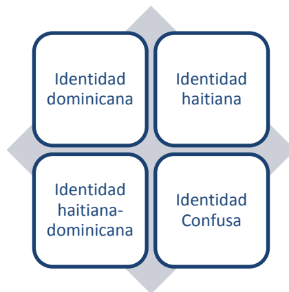
ILUSTRACIÓN 2: PATRONES DE DEFINICIÓN DE LA IDENTIDAD

Esta separación en la definición de la identidad de de la identidad será desarrollada en los siguientes acápite.