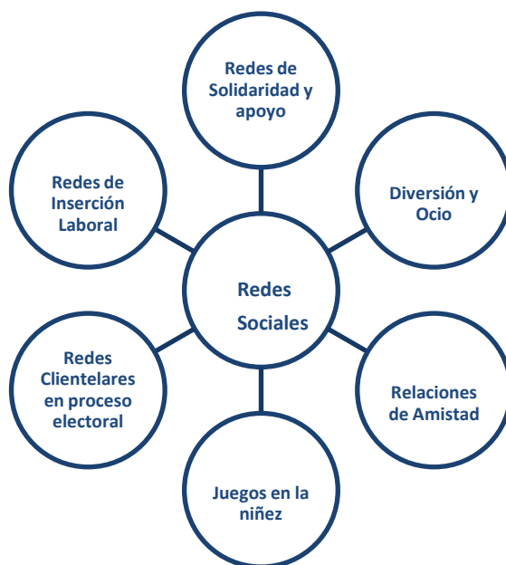
ILUSTRACIÓN 3: REDES SOCIALES DE LA POBLACIÓN DOMINICANA DE ASCENDENCIA HAITIANA

Las principales redes sociales las encontramos vinculadas a actividades como son: